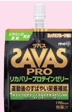
ミックスフルーツ風味

吸収の良い「ホエイプロテイン」とエネルギー補給に優れた「マルトデキストリン」を理想的なバランスで配合。 マラソンで酷使したカラダのリカバリーをサポート！