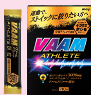
栄養ドリンク風味