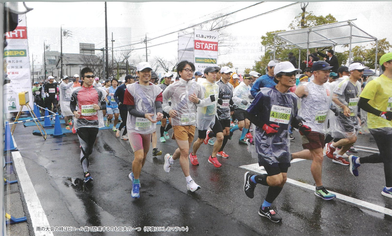
雨の大会の時はビニール袋で防寒するのも工夫の一つ (写真はにしおマラソン)

必ず事前に試しましょう シューズやウェアのサイズ、エナジーゼルの味、開けやすさ、食べやすさ、ランニングウォッチやランニングアプリの使い方、本番と同じ荷物を持って走ってみて、揺れて走りにくいかなどです。(大角)