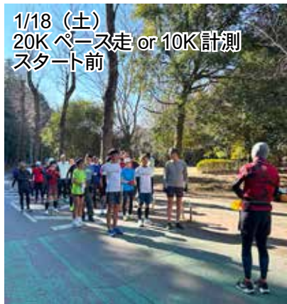
1/18 (土) 20K ペース走 or 10K 計測 スタート前