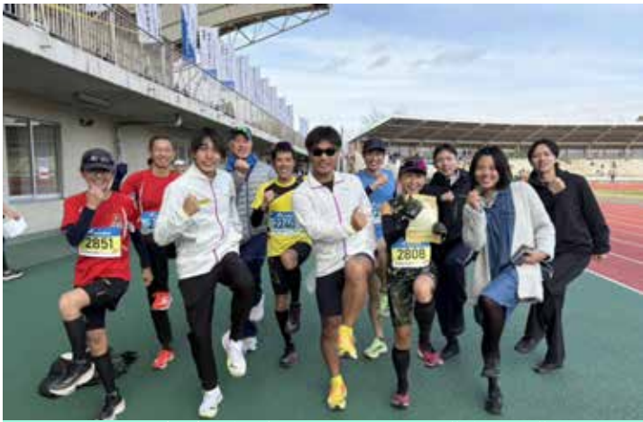
1/19 (日) 柏新春マラソン 10K 《柏の葉》