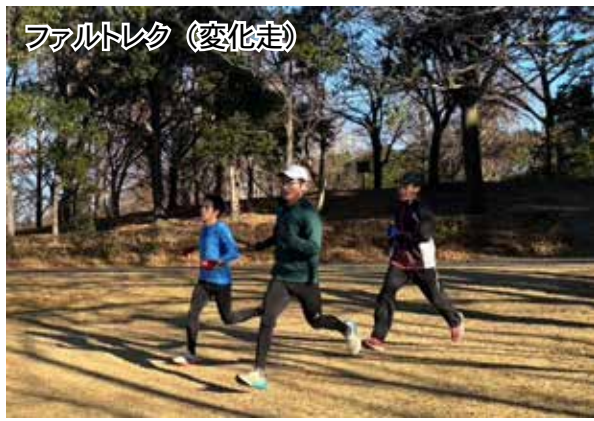
ファルトレク（変化走）

私のフルベストは今から26年前、3月に行われていた日比野賞豊橋マラソン（2時間25分）です。当時は11月つくばマラソン、2月東京国際マラソン、3月に1レースなど年に2〜3回フルへ出場していました。私の場合、幾つかレースをこなしてから3戦目にベストな走りをするパターンが多かったです。3月は季節の入れ替わりで天候が荒れる場合が多くなります。天候に恵まれて、連戦での経験値と練習とがマッチすれば、ベストなレースは可能かと思えます。レースでは最後までベストを尽くしていきましょう。 （小西）