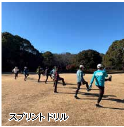
スプリントドリル