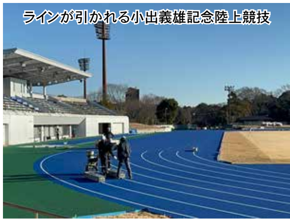
ラインが引かれる小出義雄記念陸上競技

2025年の活動がスタートしました。トラック改修工事が進み、青いトラックに白いラインが引かれています。利用再開が待ち遠しいです。