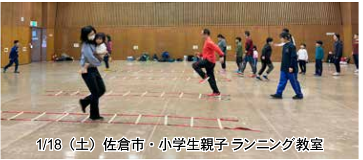
1/18 (土) 佐倉市・小学生親子ランニング教室