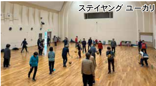
ステイヤング ユーカリ