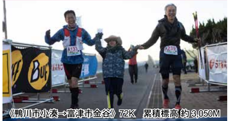
《鴨川市小湊→富津市金谷》72K 累積標高約3,050M