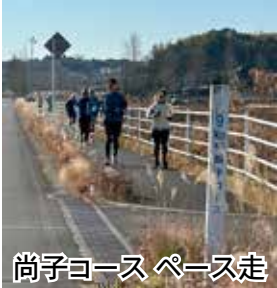
尚子コース ペース走