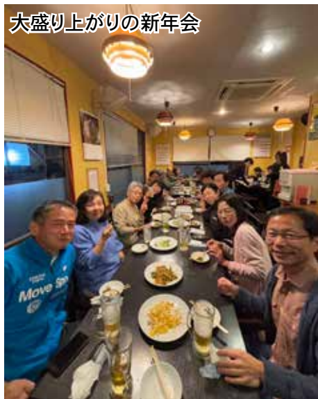
大盛り上がりの新年会