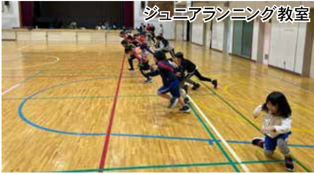
ジュニアランニング教室