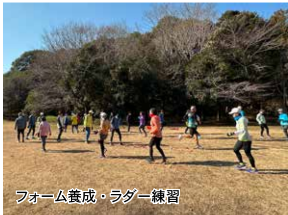
フォーム養成・ラダー練習

野球場工事の関係でクロカン・不整地の利用が制限されています。冷え込む中、舗装路練習が続いたことも理由でしょう。か？故障・違和感に悩まされている方が増えていると感じます。練習で負荷をかけること以上に回復やケアに気配りをしていきましょう。シユー