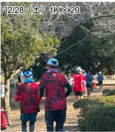
12/28 (土) 1K×20