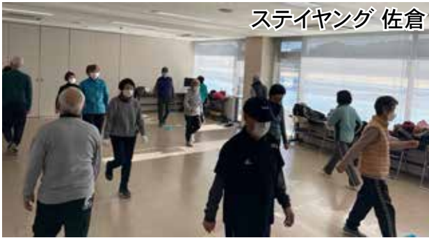
ステイヤング 佐倉