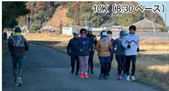
10K (8.30 ペース)