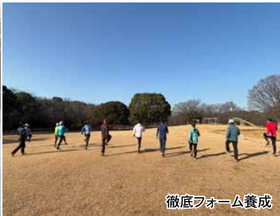
徹底フォーム養成